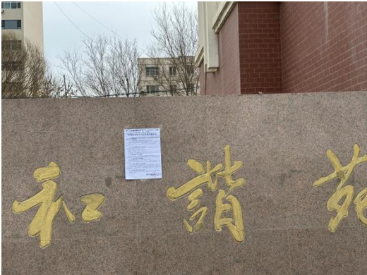
鄯善县和谐苑小区