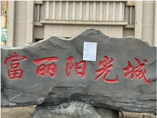
鄯善县富丽阳光城小区