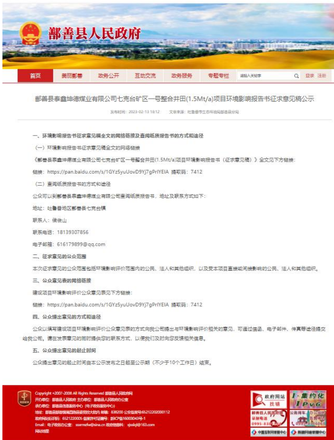
图2 报告书征求意见稿网络公示截图