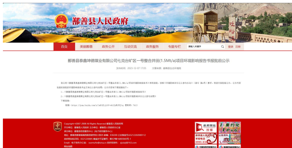
图 6 报批前公示截图

公示网络载体为项目所在地政府网站，符合《环境影响评价公众参与办法》关于网络载体选取要求，公示截图如图 6。